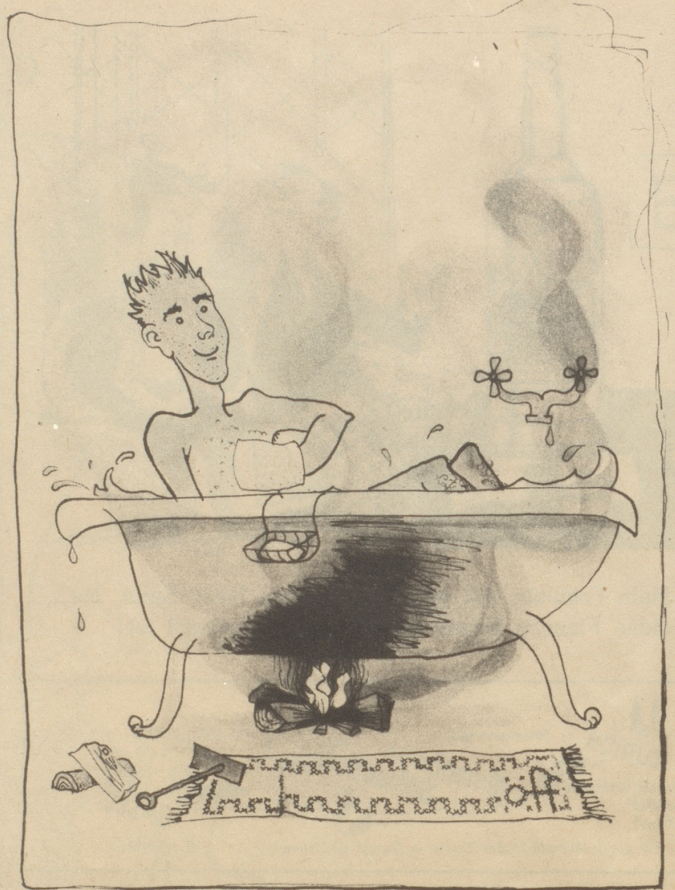
Brennholz frei — Boiler gesperrt!