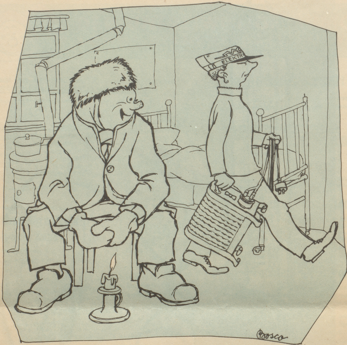
Humor ist, wenn man trotzdem lacht!