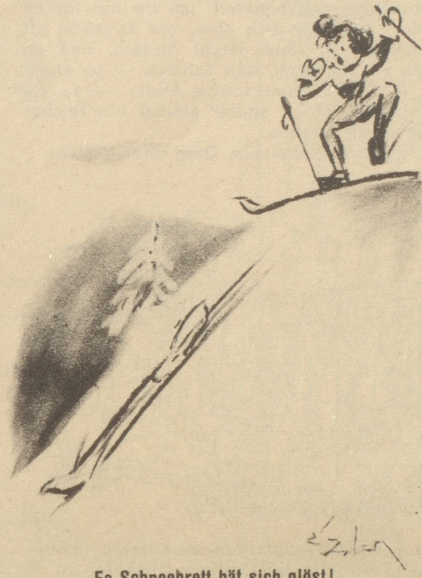
Es Schneebrett hat sich glöst!

«Mister Jean, es steht fest für mich, daß es nicht gerade der glücklichste