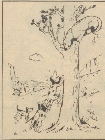
Neue Wege zeigen Field & Stream, Oktober 1946