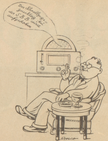
„Die händs na choge gleitig gmerkt, daß das e tummi lirichtig gsi isch!“