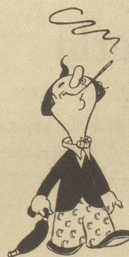
Casimir raucht Capitol

Pully/Lausanne Postversand Postfach Gare, Lausanne