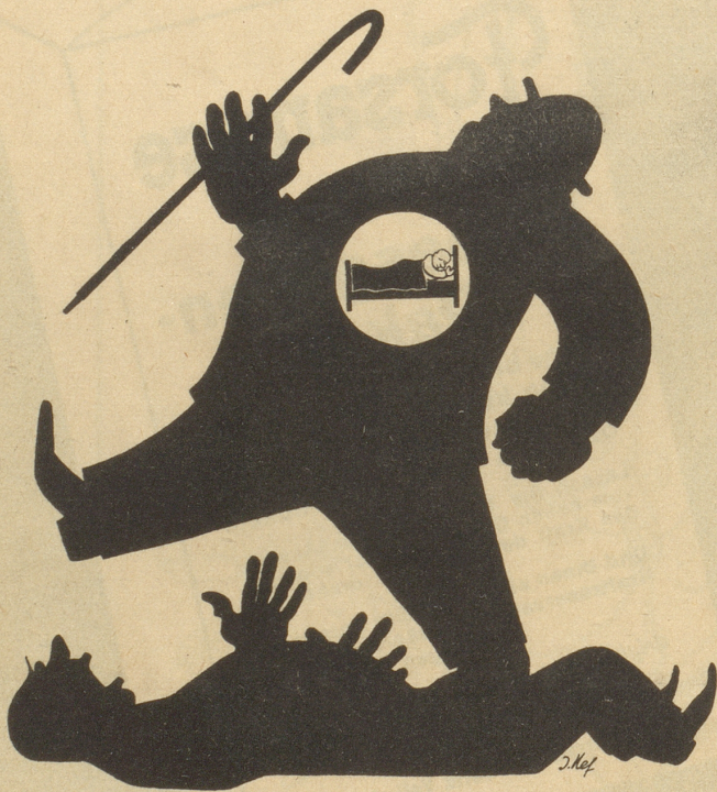
Das gute Gewissen