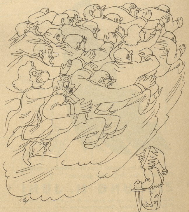
Spalterli: Was isch was isch? Die Masse: 's hät eine d'Woret gsait!