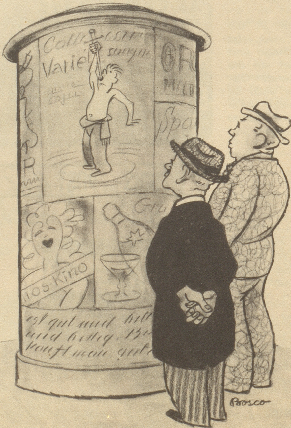
„So en Schwertschlucker zücht doch nümme — wo jetzt ganzi Völker Sichle schlucked!“

Senkrecht: 1 Mode, 2 freut, 3 Bein, 4 euch, 5 Elend, 6 Sehrohr, 7 bald, 8 Esau, 9 reifen, 10 Not, 11 Park, 12 Isa, 13 Uri, 14 Schwan, 15 Schein, 16 Herr, 17 Meran, 18 nun.