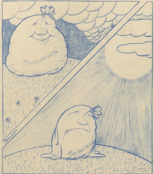
Sie gewinnt nicht durch das Lagern!