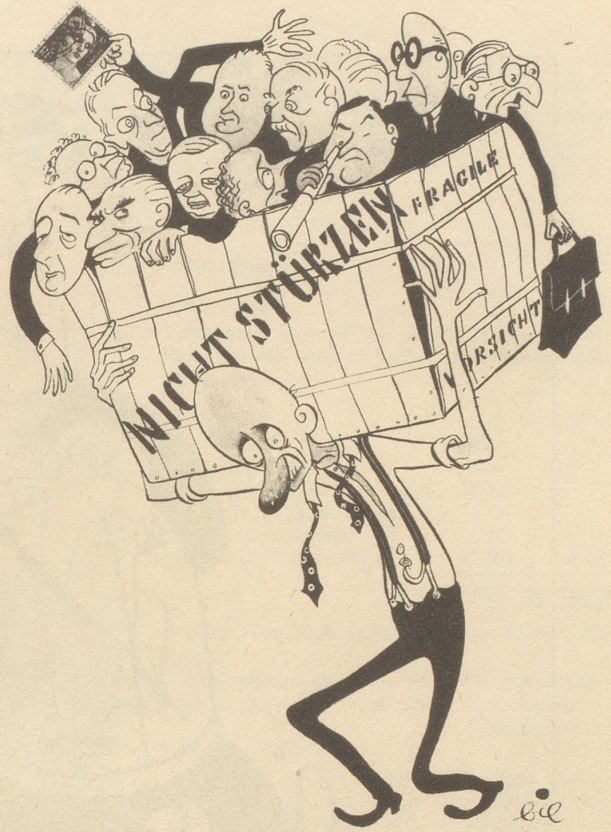
Das achtundvierzigstündige Ministerium