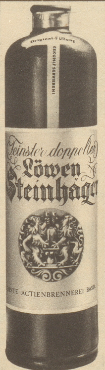
Erste Aktienbrennerei Basel

MAHALLA-CIGARETTEN-FABRIK RICHTERSWIL/ZCH.