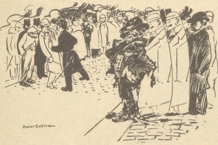
Strolch: «Wenn der König nicht bald kommt, kann er mich nicht sehen.» Söndagsnisse-Strix