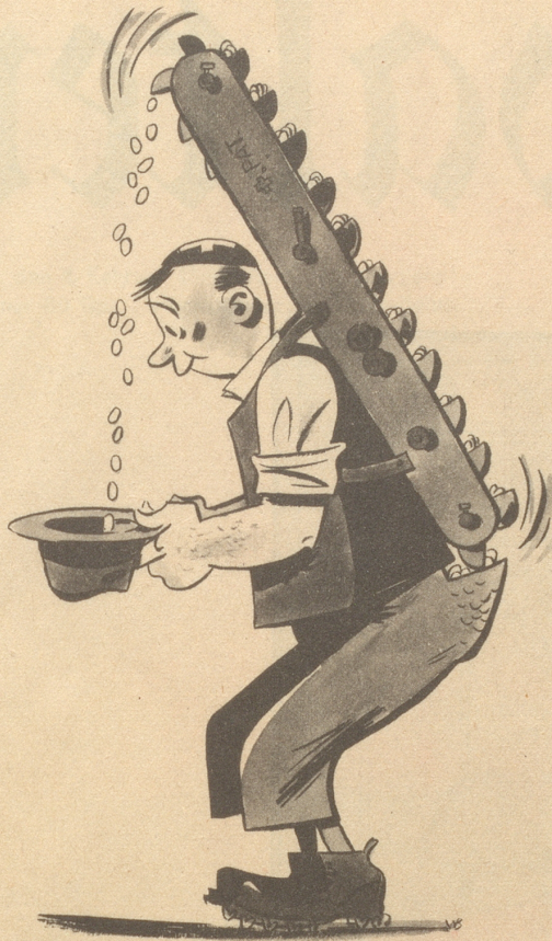
Die Aufwendungen des Bundes für die Verbilligung der Lebenskosten für 1948 = 259,3 Millionen Fr.