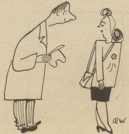
«Tschuldigid Si, Frölein: ich sött Ihne en Grueß usrichte ...» «So, vo wem?» «Vo mir.»