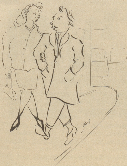
«Ich hau's über de Sunntig is Schügebiet!» «Häsch Gäld?» «Sowieso. Ha d'Schii verhauff.»

Wenn die geplagte Hausfrau nach wochenlangen Kämpfen, die sie teils in den Inseratenseiten eines guten Dutzends Zeitungen, teils auf fast ebenso vielen Stellenvermittlungsbureaux abgespielt haben, schlussendlich eine «Perle» im Haus hat (nicht nur versprochen auf dem Papier!), so kann man das Hochgefühl, das die Siegreiche durchbraust, höchstens mit dem Gefühl des Sisyphos vergleichen, das dieser allenfalls gehabt hätte, wenn es ihm je gelungen wäre, seinen Felsmücken