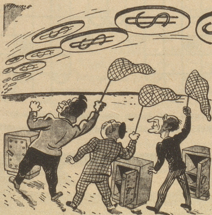
Die fliegenden Teller sind in Italien gesichtet worden. Il Travaso