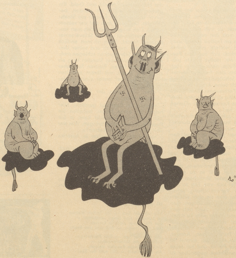
Stalin macht Volksdemokratien