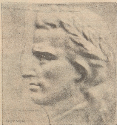
Johann Wolfgang von Goethe

Dieses Bild fand ich im Goethejahr in einer bekannten österreichischen Fremdenzeitschrift «Die Stimme Österreichs», Januarnummer 1949.