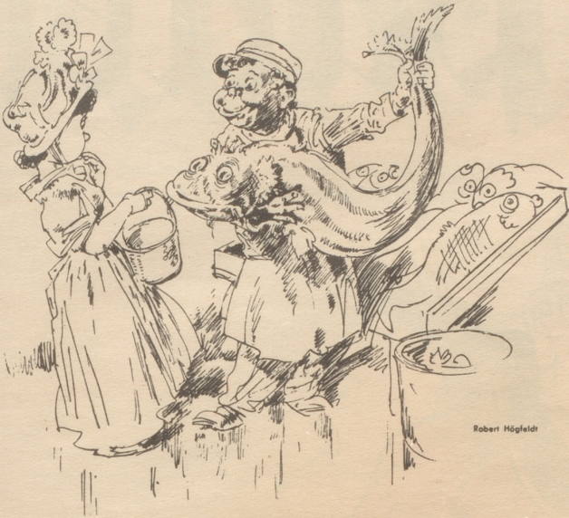
«Nämezi dä Frölain».