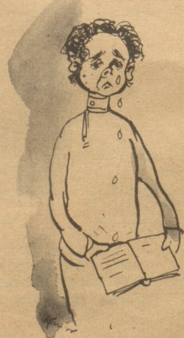
Vignetten von H. Knorr

«Wohlleben erzeugt Verstand, Unglück aber raubt einem den letzten Rest. Aus einem kleinen Riß wird bald ein großes Loch.»