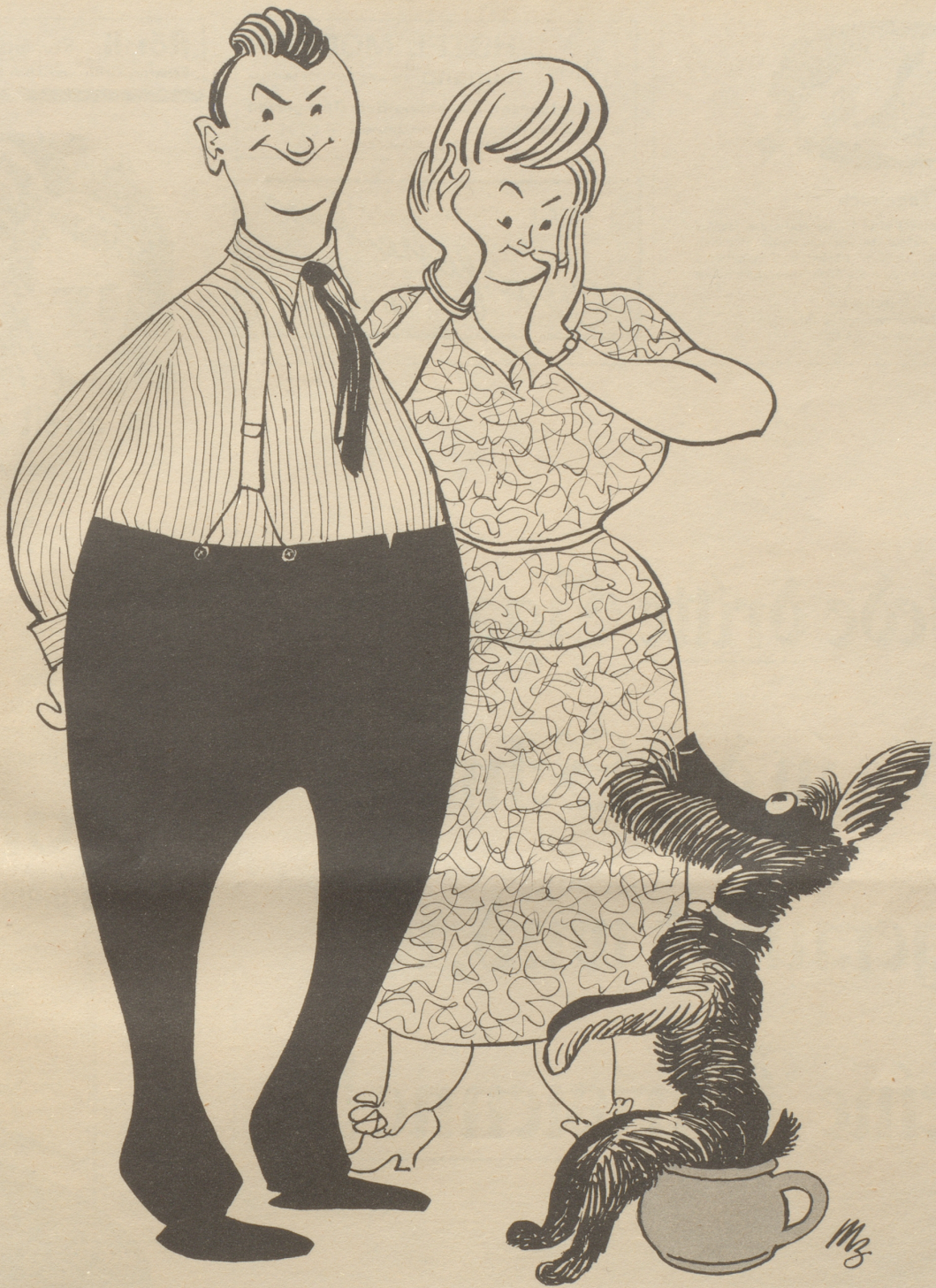
Wunder der Dressur