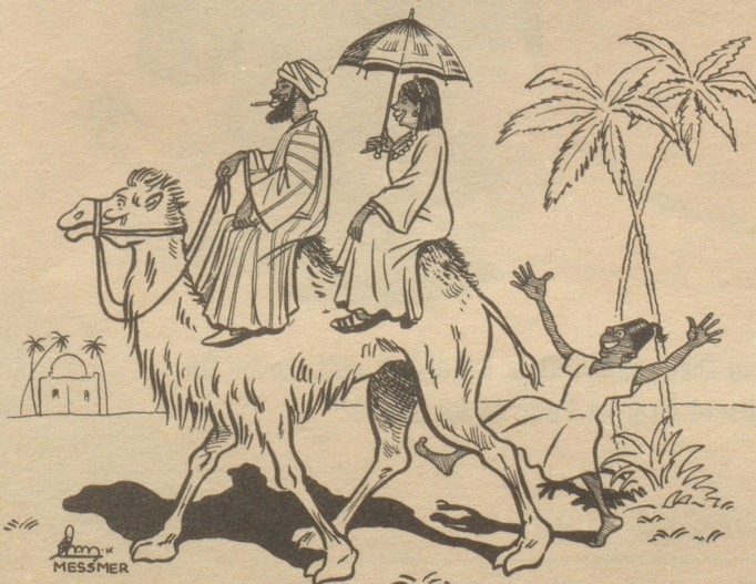
Tandem in Afrika