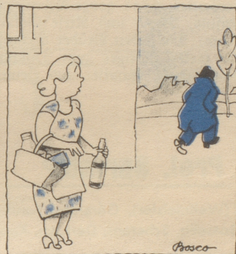
Da verzweifelte der Mann an der heutigen Welt!

Sie gibt es in jedem Dorf und jeder Stadt und jedem Land.