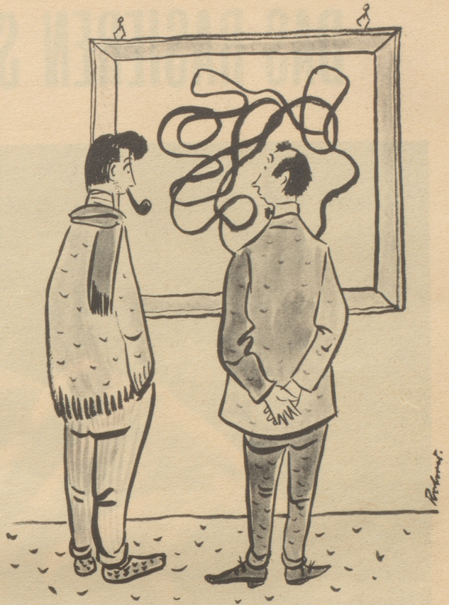
«Hät das öppis mit Politik ztue?»