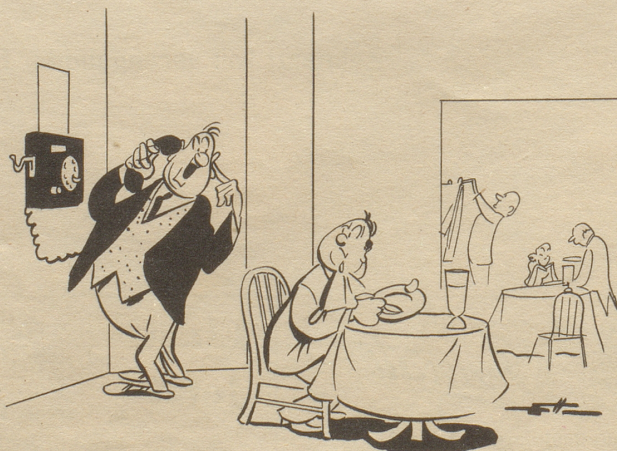
„Etz höred Si doch en Momänt uf ässe — so verschtään ich öppis am Telfoon!“

In der Annahme, alle seine Leser von der Wahrhaftigkeit der Horoskope überzeugt zu haben, wird darum der Nebelspalter im Jahre 1950 jeden Monat sein durch keinen Nebel behindertes Horoskop veröffentlichen.