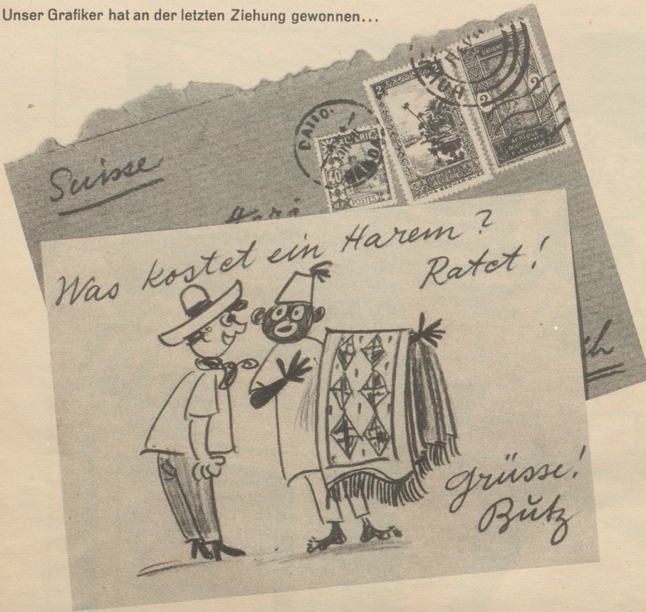
3. Nachricht aus Afrika!