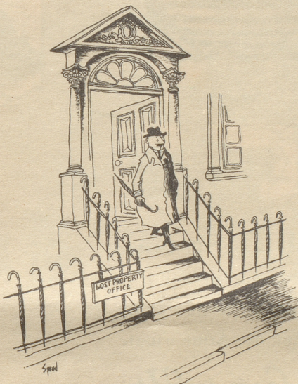
Das Fundbüro