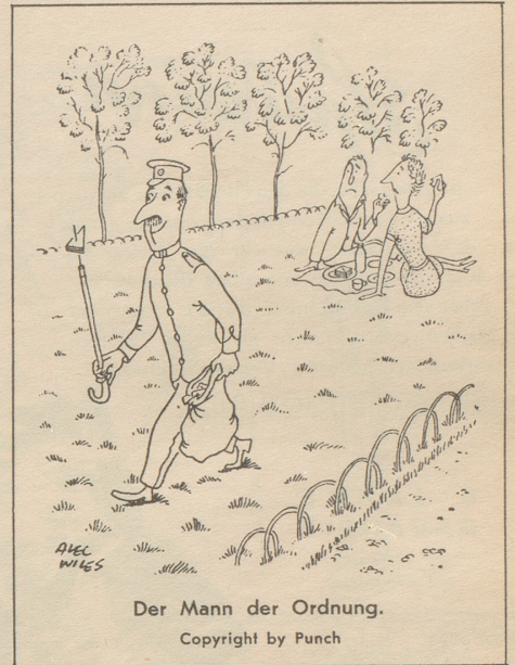
Der Mann der Ordnung.