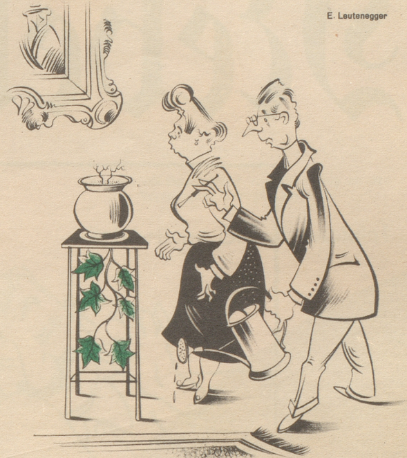
Scho wider de Setzlig vercheert ligschteckt!