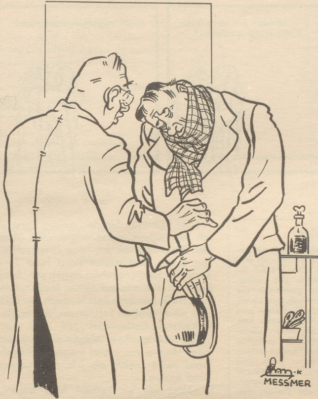
„Wo hänzi sich dann die Halscheerli gholet Herr Schtünzi?“ „Im Kunschthuus, i dr abschtrakte Uusschtelig.“