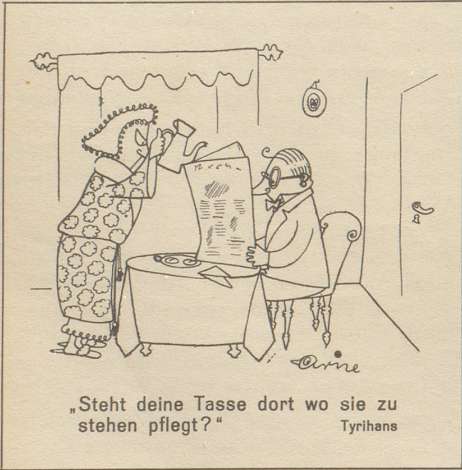
„Steht deine Tasse dort wo sie zu stehen pflegt?“ Tyrhans

Ich habe noch immer den Glauben, daß meine Ehe «im Himmel» geschlossen sei.