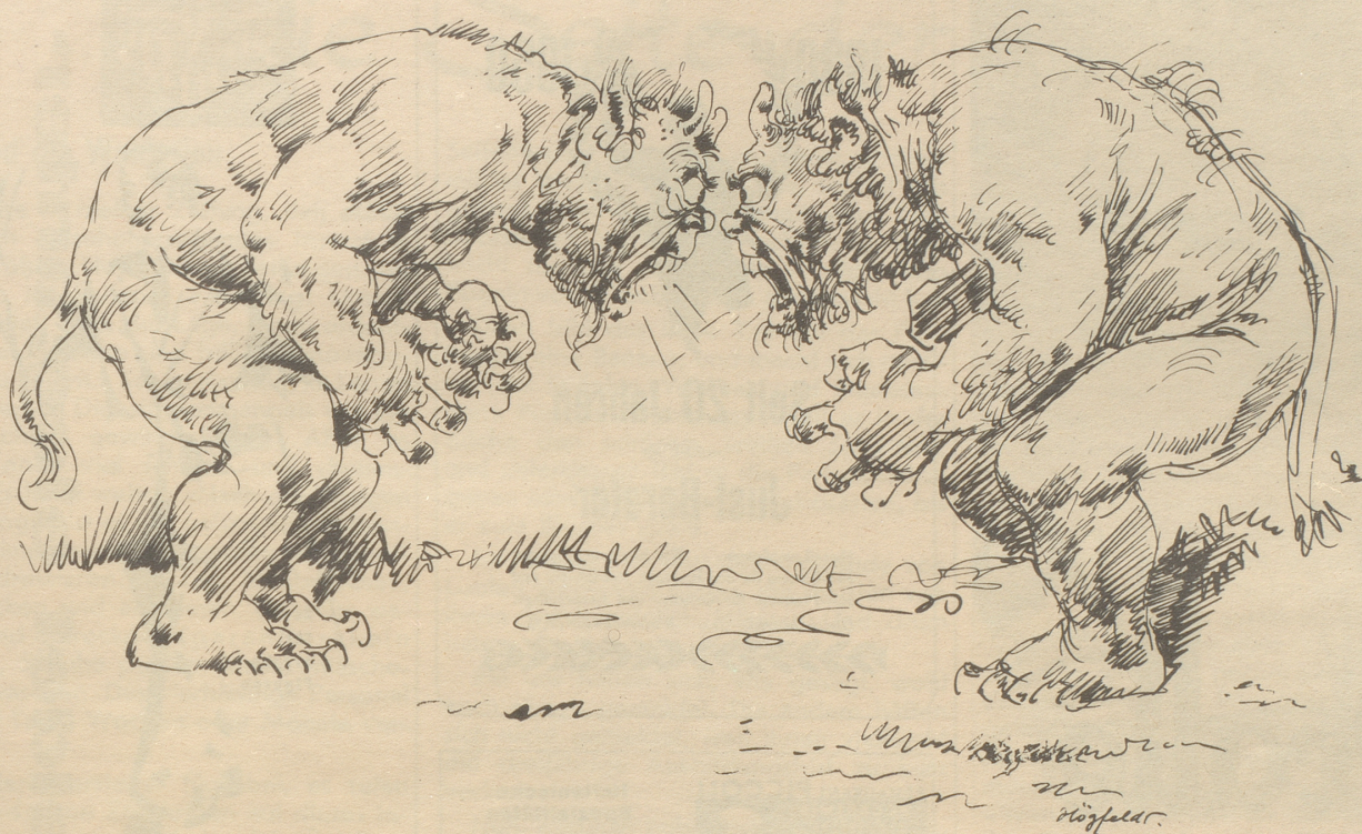
Cherchez la femmel