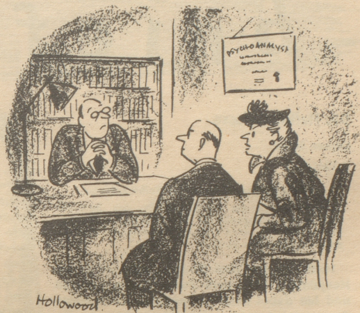
« Herr Professor, wir wollen wissen, wer von uns den Minderwertigkeitskomplex hat. »