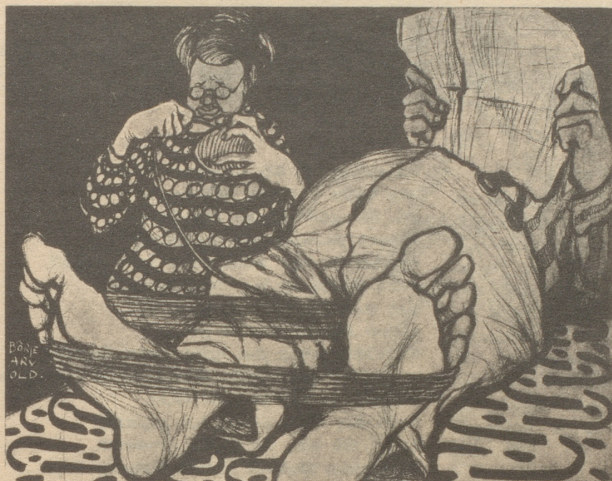
Die vollkommene Ehe.