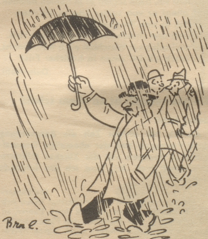
Johannsson hat geheiratet!