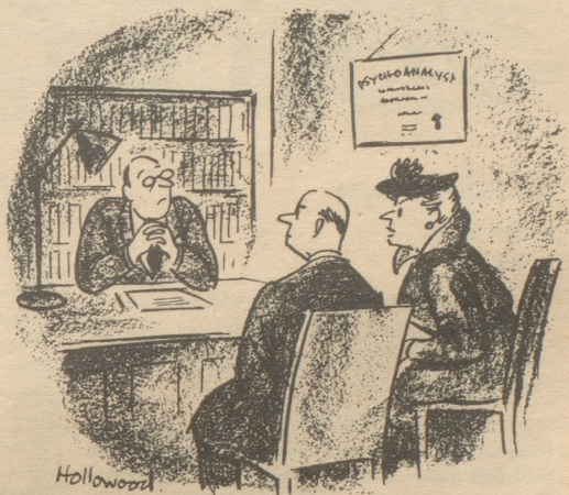
« Herr Professor, wir wollen wissen, wer von uns den Minderwertigkeitskomplex hat. »