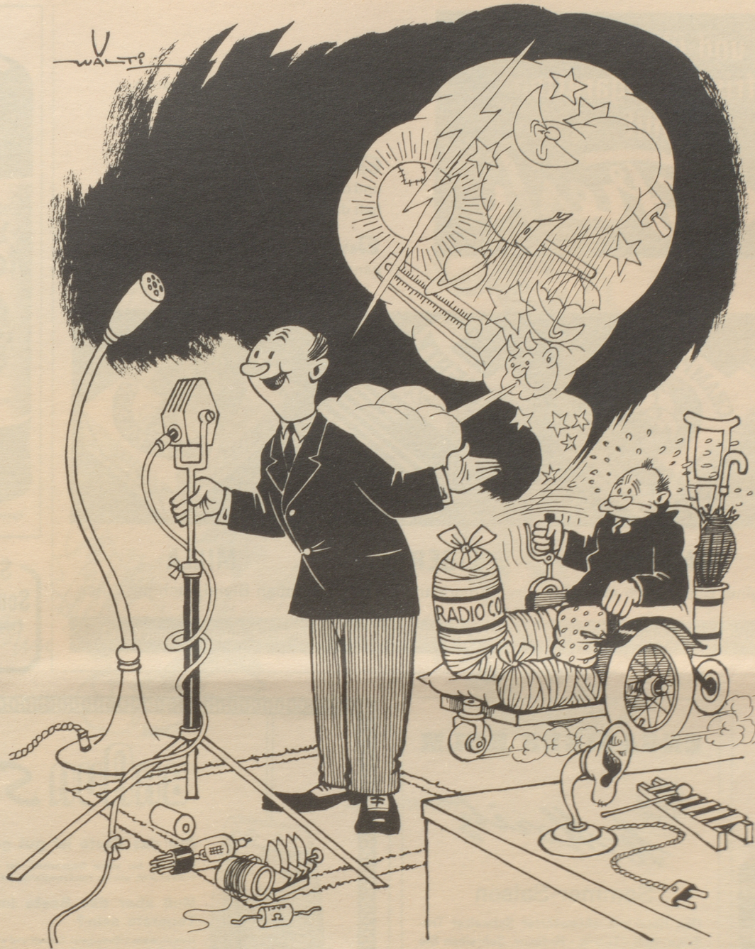
Und jetzt die Wettervorhersage auf Grund unserer neuen Methode — — —