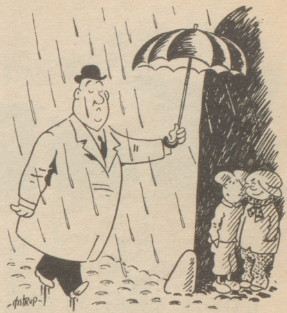
«Waisch er isch Portier!» Tyrihans

«Das isch mir gliich!» gibt ihm der Moser gemächlich zur Antwort: «Weisch, Herr Präsident, i ha sowieso nöd im Sinn gha, lang do z bliibe!» Brun