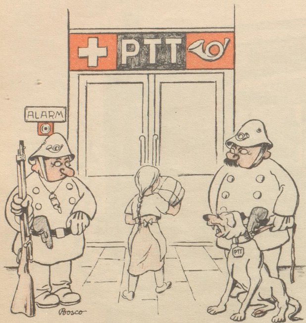
Bewaffnete Pöschtlter, ein Gebot der Stunde!

380 gesammelte Zeichnungen aus dem Nebelspalter von Carl Böckli und seinen Mitarbeitern aus der Zeit des roten und braunen Terrors: