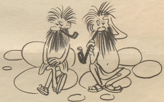
Jetzt sollte man noch den Tabak erfinden