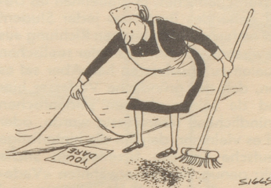
Sie dürfen ...

Soll ich nun, oder soll ich nicht? Trudy