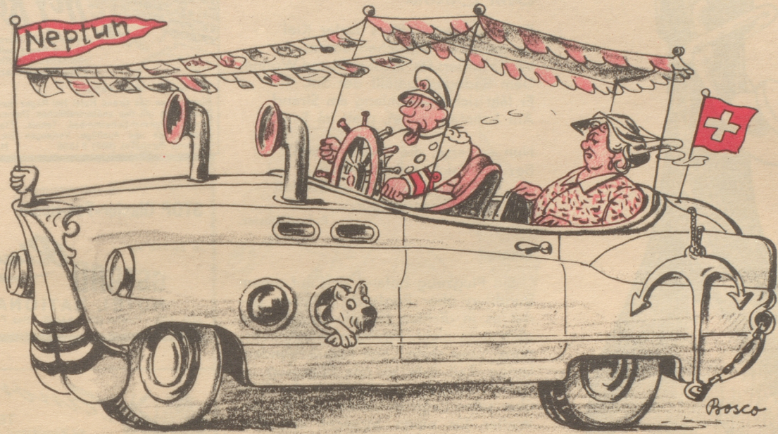
für den Ex-Kapitän