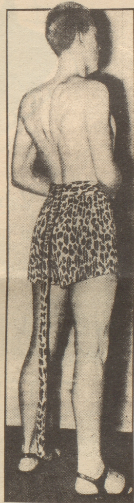
Der Schwanz ist abnehmbar.

Beiliegend schicke ich Dir ein Bild aus dem «Sunday Express», London: Englands Männer am Strand. Was sagst Du dazu!