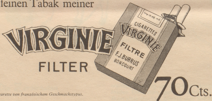
Eine Cigarette von französischem Geschmackstypus.

Rennt, schuffet! Zahlt noch mehr Steuern! Ich freue mich am neuen Filter und am feinen Tabak meiner