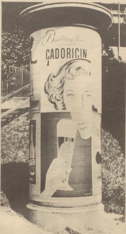
Plakatsäule im Hochsommer