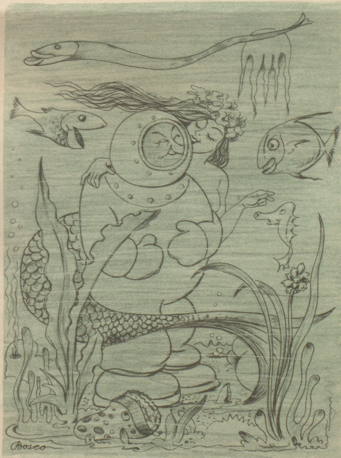
„Chumm, ich weiß da hinde e verschwiges Auschtereänkli.“

Nun, vielleicht gelingt's mir im nächsten Sommer. Bethli.