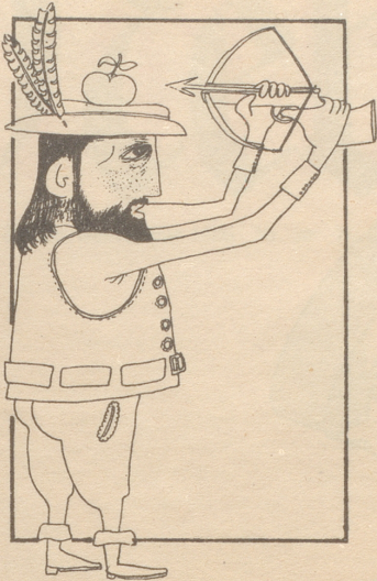
Sparsamkeit im Theater Ulenspiegel