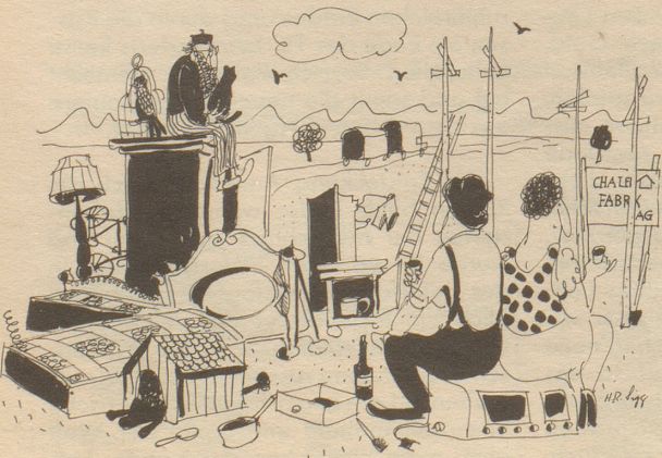
Es gaat ja alls wie am Schnüerli, z Mittag bringeds dänn na s Huus!