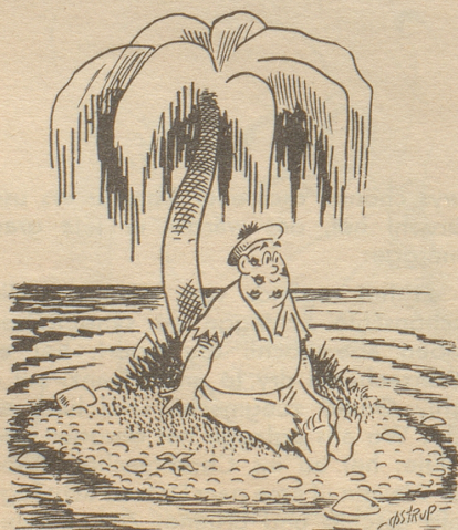
«Ich habe soeben sehr eindrücklich geträumt!» Tyrthans