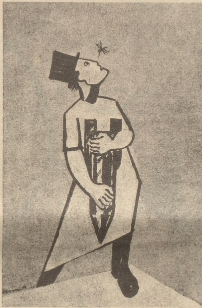
Die Menschheit, die Wasserstoffbombe und die unberechenbare Mücke.

Unlängst war mein Neffe als Pilger in Rom. In einer Pilgergruppe war ein älterer Junggeselle von W., ein gelungener Kerl. Der sagte: «Wißt Ihr, vor dreißig Jahren war ich nach Lourdes gegangen und habe um eine Frau gebetet, und jetzt mache ich eine Wallfahrt nach Rom, um dem Herrgott zu danken, daß ich keine gefunden habe.» WB