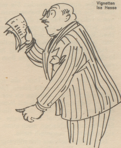
Vignetten Isa Hesse

«Hätte ich die ganze Nacht vor dem Hotel stehen sollen, Mr. Talbot? Wie hätte dann der nächste Arbeitstag ausgesehen? Ich konnte mich in dem schlechtgeführten Hotel nur bemerkbar