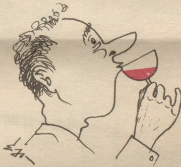
Sauser im (Übergangs) Stadium!

jetz nie en Antwort chönne gää?» Der Stillgebliebene nahm die günstige Gelegenheit wahr, um sich auch einmal zu melden und mit einem Ruck fuhr sein Arm in die Höhe: «Ich, ich.» H