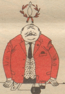
Bild. Das ist ja gerade das Einzigartige an seiner Begabung, daß er beides beherrscht wie welland Wilhelm Busch.